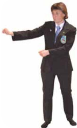
Pénalité pour attitude défensive