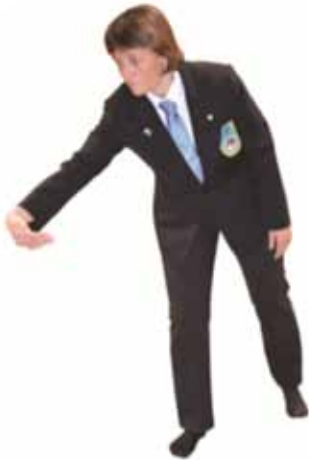
Pénalité pour saisie de jambe