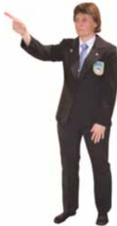
Attribuer une pénalité