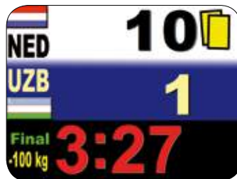
Tableau d'affichage électronique

EXEMPLE : Le blanc a marqué Waza-Ari et a été également pénalisé par un (1) Shido.