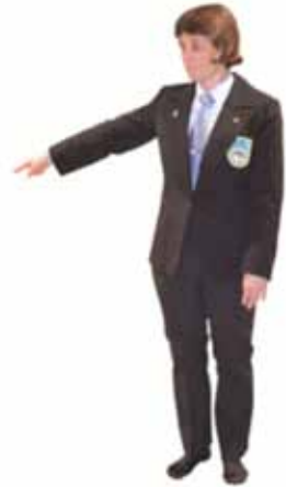
Pénalité pour sortie de tapis