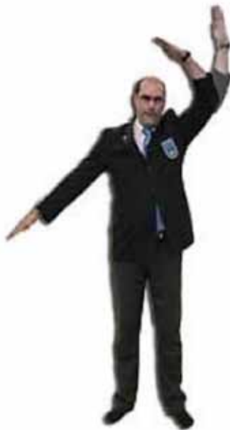
Pour annuler une opinion exprimée