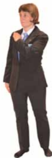
Pénalité pour refus de Kumi Kata (protection du revers)