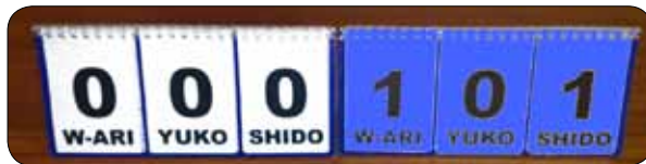
Tableau d'affichage manuel

Les chronomètres manuels doivent être utilisés simultanément avec l'équipement électronique, en cas de panne. Les tableaux indicateurs manuels doivent être disponibles en réserve.