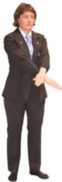
Ajuster le Judogi