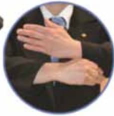
Pénalité pour prise "pistolet"