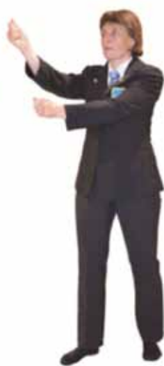
Pénalité pour garde croisée