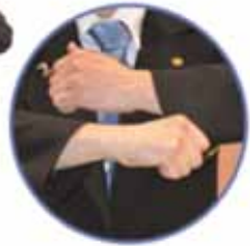
Pénalité pour doigts à l'intérieur de la manche